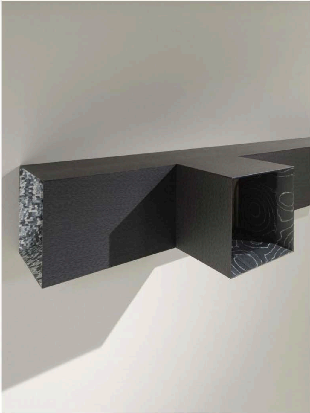
ALPI Mostra La Tavola degli Elementi, Zirconio design by Piero Lissoni ©Santi Calcega