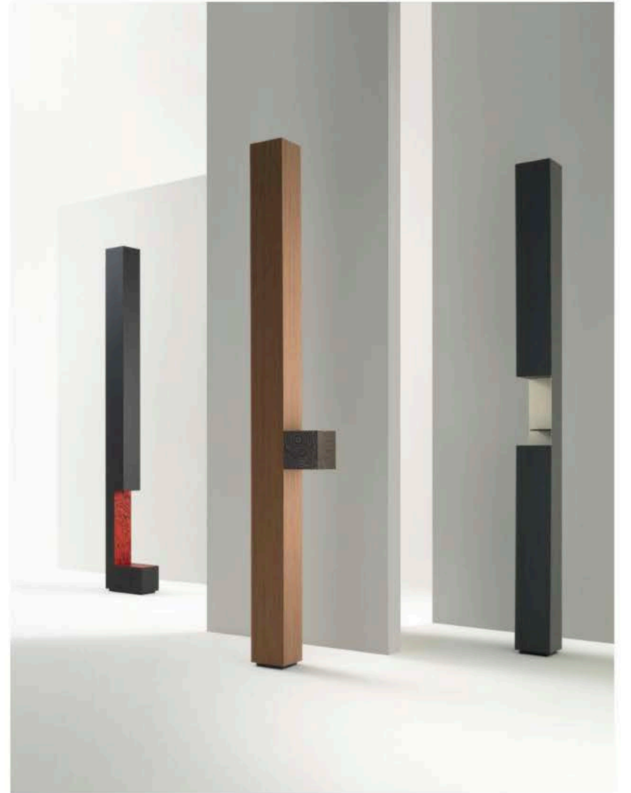
ALPI Mostra La Tavola degli Elementi. Xeno, Idrogeno and Palladio design by Piero Lissoni